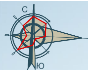
СХЕМА ГРАНИЦ ЗОН С ОСОБЫМИ УСЛОВИЯМИ ИСПОЛЬЗОВАНИЯ ТЕРРИТОРИИ М 1: 25 000